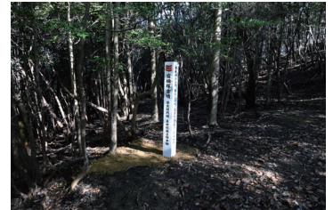
宿禰塚古墳 (造出付円墳) (市指定史跡)