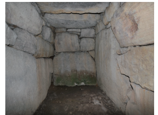
那波野古墳 (円墳) (県指定史跡)