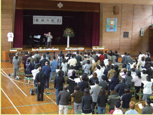
相生中学校「最後の授業」 体育館で校歌斉唱（2007年3月）