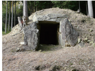
若狭野古墳 (方墳) (県指定史跡)